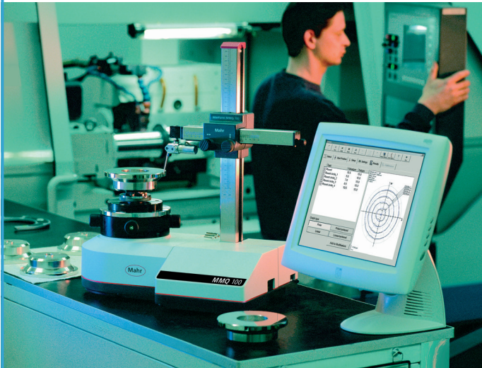
Formtester MarForm MMQ 100